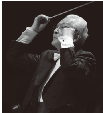
指揮 秋山和慶 Conductor / Kazuyoshi Akiyama