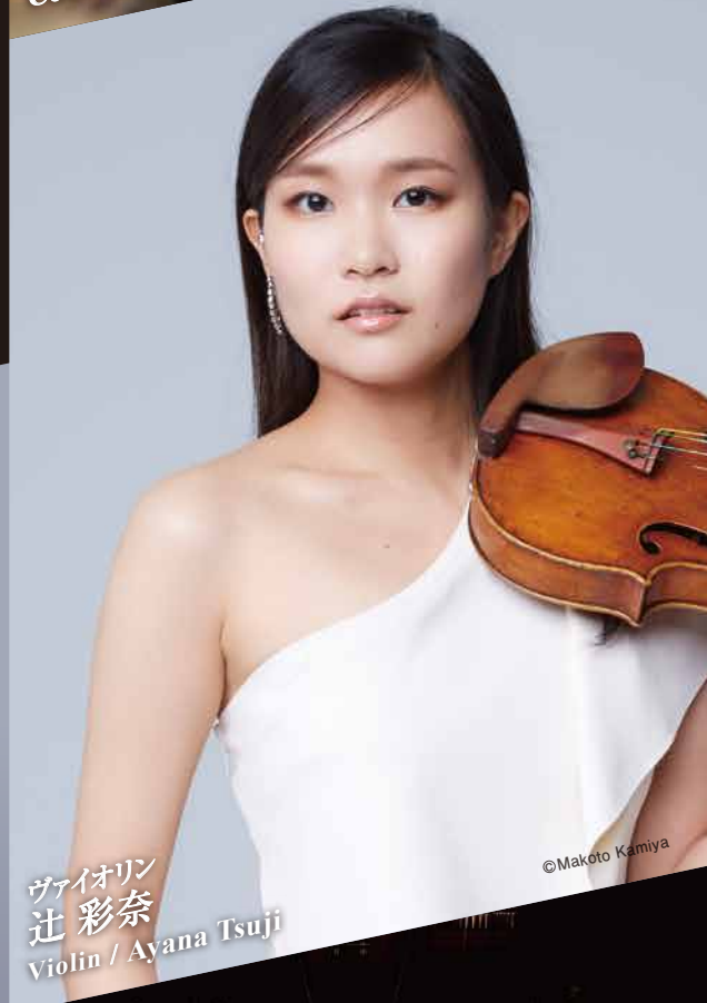
ヴァイオリン 辻彩奈 Violin / Ayana Tsuji