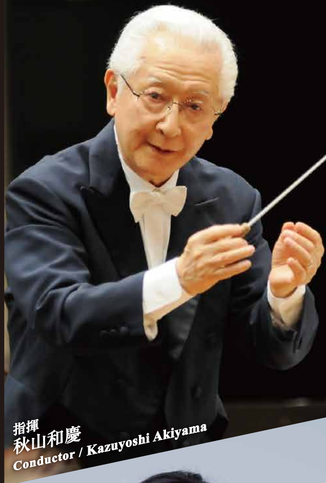
指揮 秋山和慶 Conductor / Kazuyoshi Akiyama

お問い合わせ ▶ 広響事務局 TEL: 082-532-3080 HP: http://hirokyo.or.jp