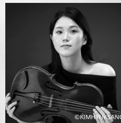
ヴィオラ:チェ・ミンジョン (崔敏楨, Choi Minjung, 최민정)