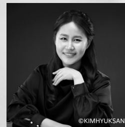
チェロ:ペ・ギユヒ (裴珪熙, Bae Kyuhee, 배규희)