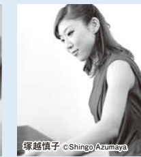
第365回定期演奏会 指揮:広上淳一 マリンバ:塚越慎子