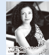
第364回定期演奏会 指揮:川瀬賢太郎 ピアノ:マリアンナ・シリニャン