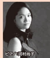
© ビアク 河村 尚子 第377回定期演奏会 指揮: 下野竜也