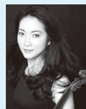
ヴァイオリン: 諏訪内晶子