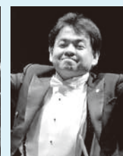
第384回定期演奏会 指揮: 下野竜也