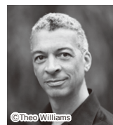
ロデリック・ウィリアムズ