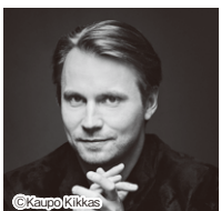
ピエタリ・インキネン