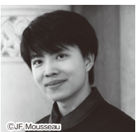
キット・アームストロング