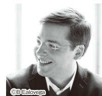
ジェームズ・フェデック

ヨラの娘》、ブラームス《交響曲第2番》、北欧とドイツロマン派が響き合うプログラムです。シン・ディスカバリー・シリーズ第4回(2/25開催)は細川俊夫作品《おお、大いなる神秘よ》《渦》に続き、モーツァルト《レクイエム》でシリーズを締めくくります。アルミンクと豪華独唱陣、エリザベト音大合唱団が祈りの音楽を紡ぎます。音楽の花束(冬)(2/28開催)にはデイヴィッド・レイランドが広響に初登場。ショパン《ピアノ協奏曲第1番》を若き俊英イリヤ・シュムクラールとともに。後半はシューマン《交響曲第1番「春」》で季節を先取る爽やかな音楽をお届けします。2025年度の最後まで目が離せない魅力的なプログラムで皆様のご来場をお待ちしております。