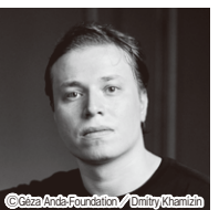
イリヤ・シュムクラール