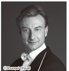
クリスティアン・アルミンク

歩んできた歴史の中に息づく数々のストーリーを重ねながら、心に響く感動のステージをお届けしてまいります。新規コンサート会員のお申し込みは2月3日(火)受付開始。皆様からのお申し込みをお待ちしております。