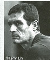
【演出】 ルーカ・ヴェッジエティ