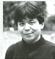
【作曲・音楽監督】 細川俊夫