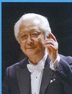
指揮：秋山和慶 Cond. Kazuyoshi Akiyama

2015.6.5 [金] 18:45開演 (17:45開場) アステールプラザ大ホール