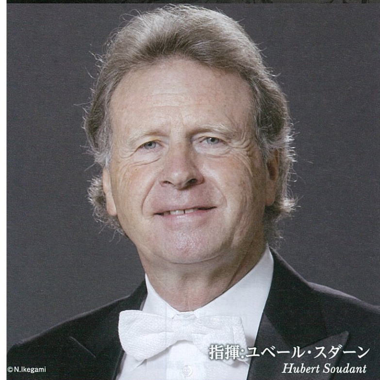
指揮:ユベール・スダーン Hubert Soudant

広島交響楽団 第350回定期演奏会 The 350th Subscription Concert