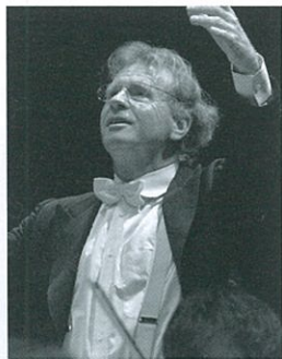
〈指揮〉 ユベール・スダーン Hubert Soudant