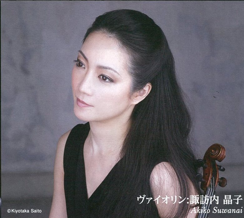
ヴァイオリン:諏訪内 晶子 Akiko Suwanai