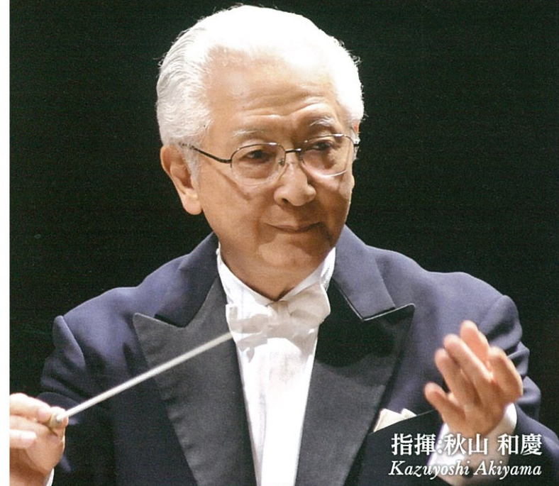
指揮:秋山 和慶 Kazuyoshi Akiyama

広島交響楽団 第352回プレミアム定期演奏会 The 352nd Premium Subscription Concert