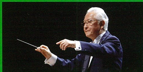
指揮：秋山和慶 Cond. Kazuyoshi Akiyama

2015.10.2 [金] 18:45開演 (17:45開場) JMSアステールプラザ大ホール