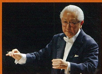
指揮：秋山和慶 Cond. Kazuyoshi Akiyama

2016.2.26 [金] 18:45開演 (17:45開場) JMSアステールプラザ大ホール