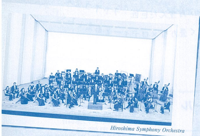
Hiroshima Symphony Orchestra

国際平和文化都市「広島」を本拠地とする、中・四国唯一の常設プロオーケストラ 広島響は、1998年に日本を代表する指揮者である秋山和慶が首席指揮者・ミュージッ クアドバイザーに就任し、2004年から音楽監督・常任指揮者を務めている。海外公 演として、ウィーン、プラハ、フランス(ルーアン、ル・アーブル)、ロシア(サンクトペテ ルブルク)、韓国(ソウル、プサン、テグ)などで公演し好評を博す。現在は年10回の 定期演奏会、呉・福山・廿日市・島根での地域定期やディスカバリー・シリーズをは じめ、依頼公演や学校コンサート、巡回コンサートなど年間約140回を超える演奏 活動を行っている。これまでに「広島市政功労賞」「広島文化賞」「広島ホームテレビ 文化賞」「地域文化功労者賞(文部大臣表彰)」「第54回中国 文化賞」「第17回県民文化奨励賞」「第5回国際交流奨励賞」 「文化対話賞(ユネスコ)」「広島市民賞(2013年度)」を受賞。