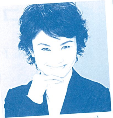
Yuko Tanaka (Conductor)