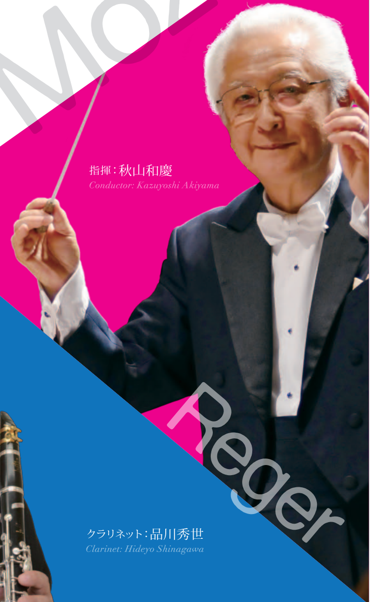
指揮：秋山和慶 Conductor: Kazuyoshi Akiyama

お問い合わせ/ 広響事務局 TEL 082-532-3080 E-mail:info@hirokyo.or.jp http://hirokyo.or.jp/