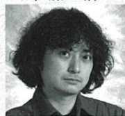
演出 栗國 淳