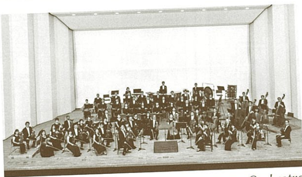
Hiroshima Symphony Orchestra