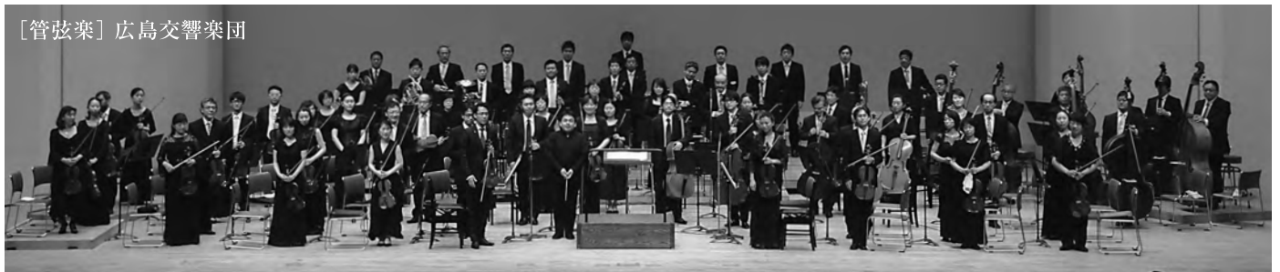
[管弦楽] 広島交響楽団

広島市と韓国・大邱広域市は1997年5月2日に姉妹都市提携を結びました。現在、隔年で芸術団を派遣し合うとともに、広島交響楽団と大邱市立交響楽団によるオーケストラ交流も行っています。