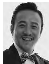
[シヨナル] ソク・サンゲン