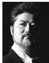
[マルチェッロ] キム・スンチョル