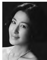
[ムゼッタ] ペ・ヘリ