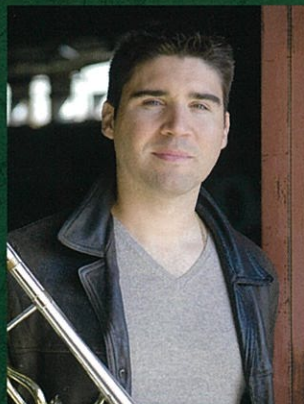
ミュンヘン国際音楽コンクール トロンボーン部門 史上初1位