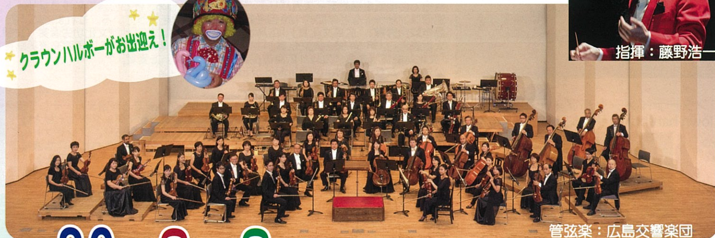
管弦楽：広島交響楽団