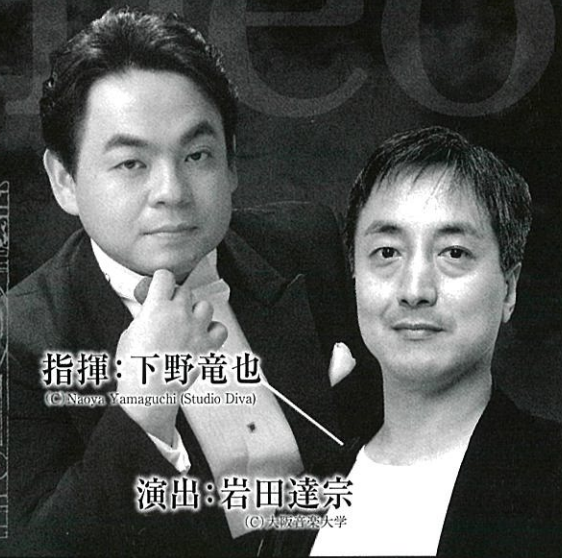
指揮：下野竜也

イドメネオの裏切りによるネプチューンの怒りは鎮まるのか…、人間たちの苦悩は…、生贄は…、そして愛の行方は…。