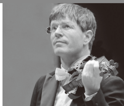
ソロ&コンサートマスター: フォルクハルト・シュトイデ Solo & Concertmaster: Volkhart Steude

交響曲第4番イ長調「イタリア」 Symphony No. 4 in A major, op. 90 "Italian"