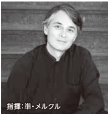
指揮：準・メルクル

※7月7日公演のチケットをご購入のお客様、定期会員、準定期会員、法人会員の皆様は、お手元のチケット、会員証で延期公演にご入場いただけます。皆様のご来場を心よりお待ちしております。