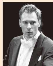
第388回定期演奏会 指揮:オリヴィエリ=モンロー