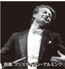
指揮：クリスティアン・アルミンク