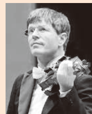
第386回定期演奏会 ソリコンサートマスター・フォルカ・ワグネル

1/19 15:00 第386回定期演奏会 2/ 6 18:45 第387回定期演奏会 3/ 3 15:00 第388回定期演奏会