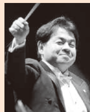
第387回定期演奏会 指揮:下野 竜也