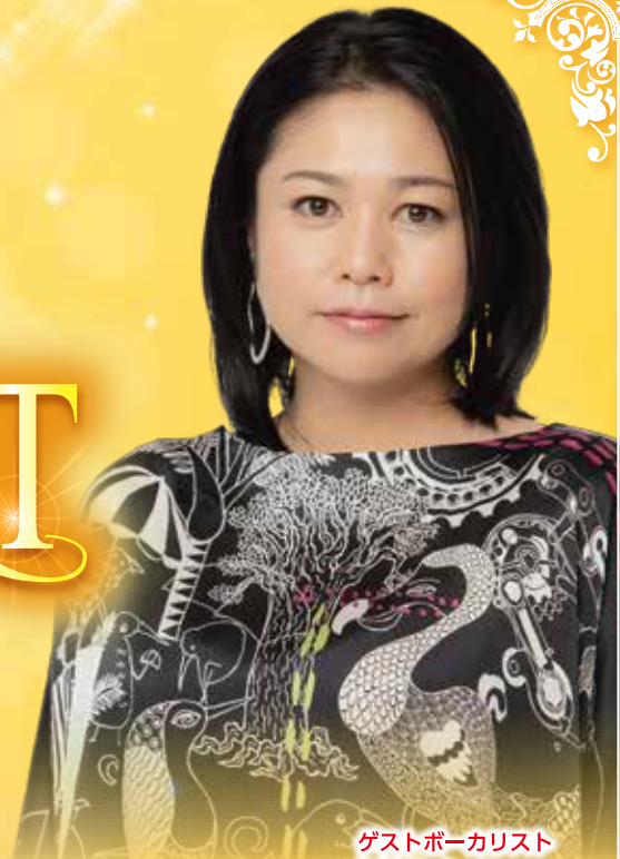
ゲストボーカリスト 夏川りみ