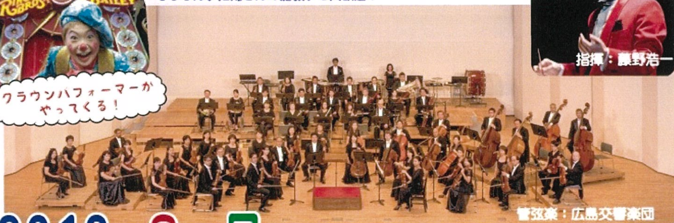
管弦楽：広島交響楽団