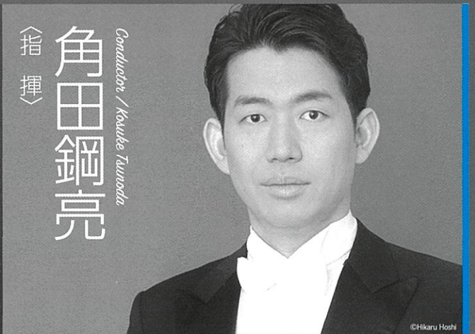
指揮 角田鋼亮 Conductor / Kouhei Tsunoda

2018年第10回浜松国際ピアノコンクールにて第2位、併せてワルシャワ市長賞、聴衆賞を受賞。2019年第29回出光音楽賞受賞。