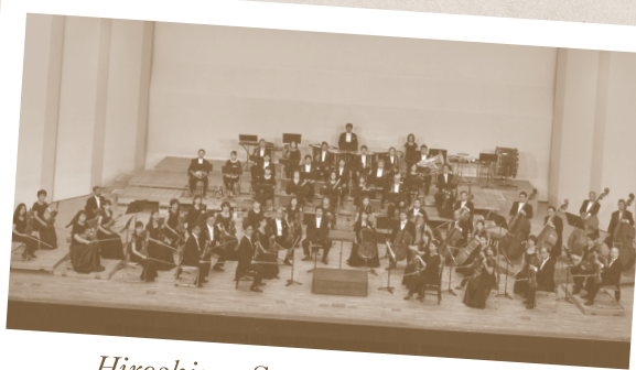
Hiroshima Symphony Orchestra

国際平和文化都市“広島”を本拠地とし、中国地方を代表するプロオー ケストラ広響は、下野竜也が音楽総監督を、クリスティアン・アルミンクが 首席客演指揮者を務めている。2004年から2016年まで音楽監督・常任 指揮者を務めた秋山和慶は、2017年終身名誉指揮者に就任した。現在は 年10回の定期演奏会、呉・福山・廿日市・島根での地域定期やディスカバ リー・シリーズをはじめ、依頼公演や学校コンサート、巡回コンサートなど 年間約140回を超える演奏活動を行っている。これまでに「広島市政 功労賞」「広島文化賞」「広島ホームテレビ文化賞」「地域文化功労者賞 (文部大臣表彰)」「第54回中国文化賞」「第17回県民文化奨励賞」「第5 回国際交流奨励賞」「文化対話賞(ユネスコ)」「広島市民賞(2013年度)」 を受賞。