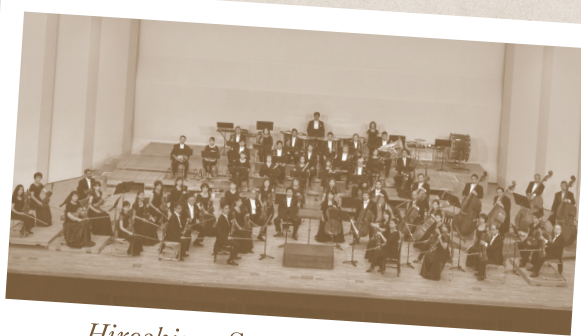
Hiroshima Symphony Orchestra

国際平和文化都市“広島”を本拠地とし、中国地方を代表するプロオー ケストラ広響は、下野竜也が音楽総監督を、クリスティアン・アルミンクが 首席客演指揮者を務めている。2004年から2016年まで音楽監督・常任 指揮者を務めた秋山和慶は、2017年終身名誉指揮者に就任した。現在は 年10回の定期演奏会、呉・福山・廿日市・島根での地域定期やディスカバ リー・シリーズをはじめ、依頼公演や学校コンサート、巡回コンサートなど 年間約140回を超える演奏活動を行っている。これまでに「広島市政 功労賞」「広島文化賞」「広島ホームテレビ文化賞」「地域文化功労者賞 (文部大臣表彰)」「第54回中国文化賞」「第17回県民文化奨励賞」「第5 回国際交流奨励賞」「文化対話賞(ユネスコ)」「広島市民賞(2013年度)」 を受賞。