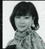
21/sat ドンナ・エルヴィーラ