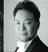
21/sat ドン・ジョヴァンニ