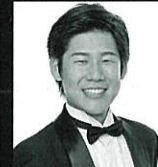
21/sat ドン・オッターヴィオ