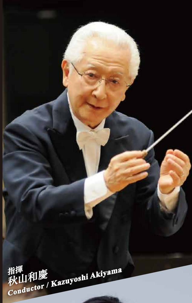
指揮 秋山和慶 Conductor / Kazuyoshi Akiyama

お問い合わせ ▶ 広警事務局 TEL: 082-532-3080 HP: http://hirokyo.or.jp