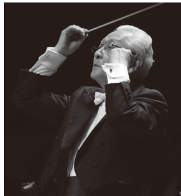
指揮 秋山和慶 Conductor / Kazuyoshi Akiyama