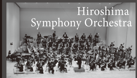
Hiroshima Symphony Orchestra

早稲田大学理工学部電子通信学科、および桐朋学園大学演奏学科を卒業。マスタープレイヤーズ指揮者コンクール優勝ほか数多くの国際コンクールにて入賞。これまでにハンガリー響、N響等内外のオーケストラを指揮するほか、アルゲリッチの要請によりパドヴァ室内管弦楽団と共演し国際的に活躍。2000-07年NHK交響楽団アシスタントコンダクター。2010年より兵庫芸術文化センター管弦楽団レジデント・コンダクター。2015年、兵庫県功労者表彰(文化功労)受賞。