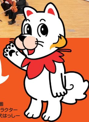
広島広域都市圏 マスコットキャラクター ひろしま都市犬はっしー

オーケストラや演奏曲にまつわる 楽しい話を交えながら プロのオーケストラの演奏を お届けするんだワン!