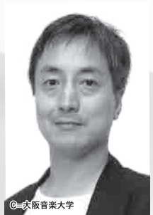
芸術監督・演出 岩田達宗