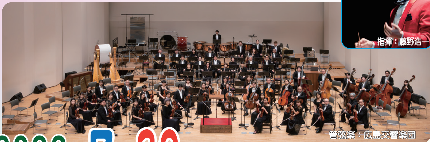
管弦楽：広島交響楽団