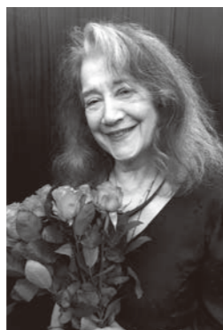
マルタ・アルゲリッチ

重ねてきた活動を振り返ると、世界中のいた るところで、いろいろな立場の人が、あまりにも 当然で正当な要求として「平和」を希求し、音 楽、文化芸術で、その願いを共有しようとして いるのだと感じます。2015年のマルタとの出 会いは、Music for Peace を大切なテーマと してきた私達、広響に新たな希望を与えるもの となり、翌2016年から、戦後75年とベート ーヴェン生誕250年、東京オリンピック・パリン ピック開催を迎える2020年へに向けて、当団