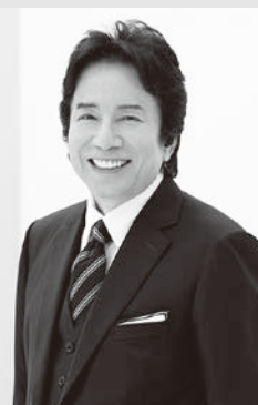
ゲストシンガー：布施明