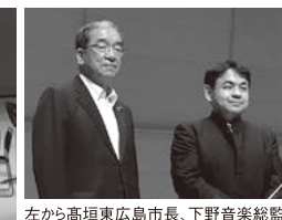
左から高垣東広島市長、下野音楽総監督