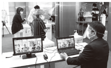
サーモグラフィによる検温チェック