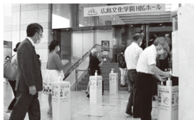
入り口での手指消毒

当日はホール席数の半数以下、前後左右に1席ずつ空けて約700人のお客様にご来場いただきましたが、皆様のご理解・ご協力のもとスムーズに運営を進めることができました。