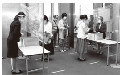
チケット、パンフレットはセルフで