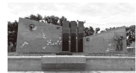
「ひろしまの塔」作・圓錐勝三（沖縄県糸満市）

て、昨年訪問したポーランドのように世界にいたるところにその事実があります。今年の7月、広響は文化庁の事業で沖縄を訪問する機会をいただきました。県民の1/4が犠牲となった悲劇の中で、ひめゆり学徒隊のように自決に追い込まれた十代の少女たち。全国から守備隊として動員された犠牲者のために各県の慰霊碑がある沖縄。昔、どこかで起こったことと、知らずにいることの怖さを感じさせます。