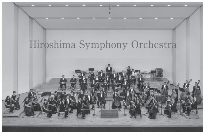
Hiroshima Symphony Orchestra