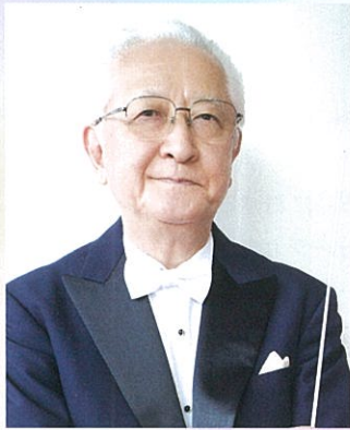
指揮 秋山 和慶 Kazuyoshi Akiyama