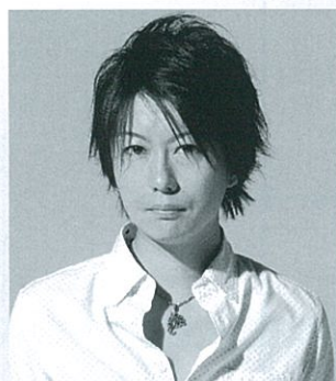
ナレーション：堀江 一真 Kazuma Horie, narration

多摩大学経営情報学部卒業。青二プロダクション附属俳優養成所「青二塾」を卒業後、同プロダクションを経て声優としてデビュー。主な出演作品はTVアニメ「夏目友人帳」：田沼要役、『デュララ!!』：矢霧誠二役、『フェアリーテイル』：ナディ/ラスティ・ローズ役、『イナズマイレブGO』：真帆路正役、また外国語作品ではBBC「オフアン・ブラック～暴走遺伝子」ポール役、韓国ドラマ「僕らのイケメン青果店」：ハン・テヤン役(チ・チャンクウ)、中国ドラマ「後宮の涙」：高湛役(チェン・シャオ)の声を務める。また小学館「幼稚園」をはじめ多数のTV-CMナレーションを担当。