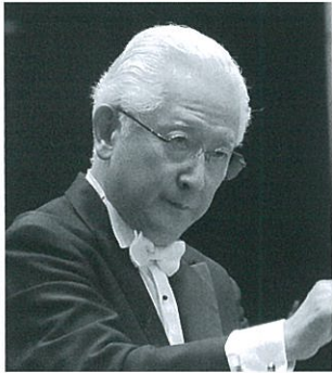
指揮：秋山 和慶 Kazuyoshi Akiyama, conductor

音楽監督・常任指揮者、秋山和慶プロデュースによる〈広響名曲コンサート〉。 名曲の数々を花束にして、あなたとあなたの大切な方へお贈りします。