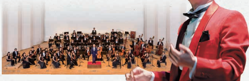
演奏：広島交響楽団 / 指揮：藤野 浩一

会場にはチャリティー募金箱を設置します。お寄せいただいた募金は「岡山県共同募金会」に寄贈させていただきます。